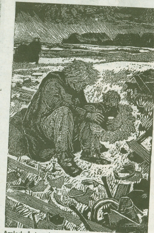
Amler på stranden. Saxo's forlæg til Shakespeares Hamlet, har det tungsindige og tøvende over sig. De s/h streger understreger følelserne i fortællingens ord.